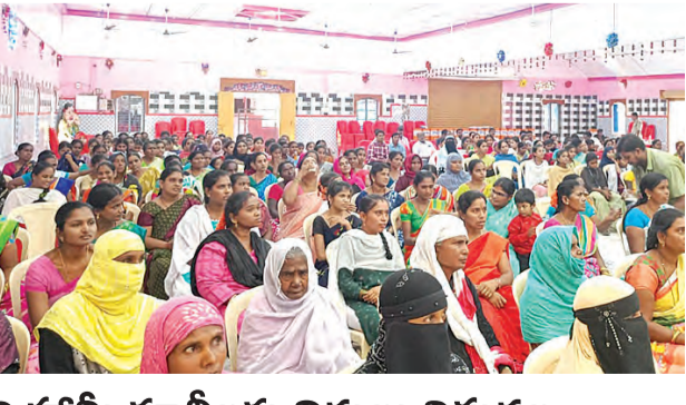
ఉపాధి హామీ కులీలకు నిధులు విడుదల